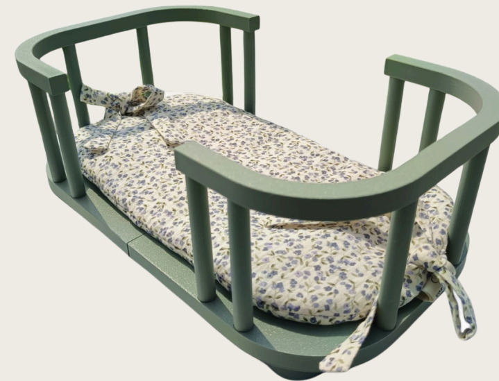
4. Materacyk można również tylko położyć na łóżeczku ale pamiętaj żeby kokardki związać na materacyku.