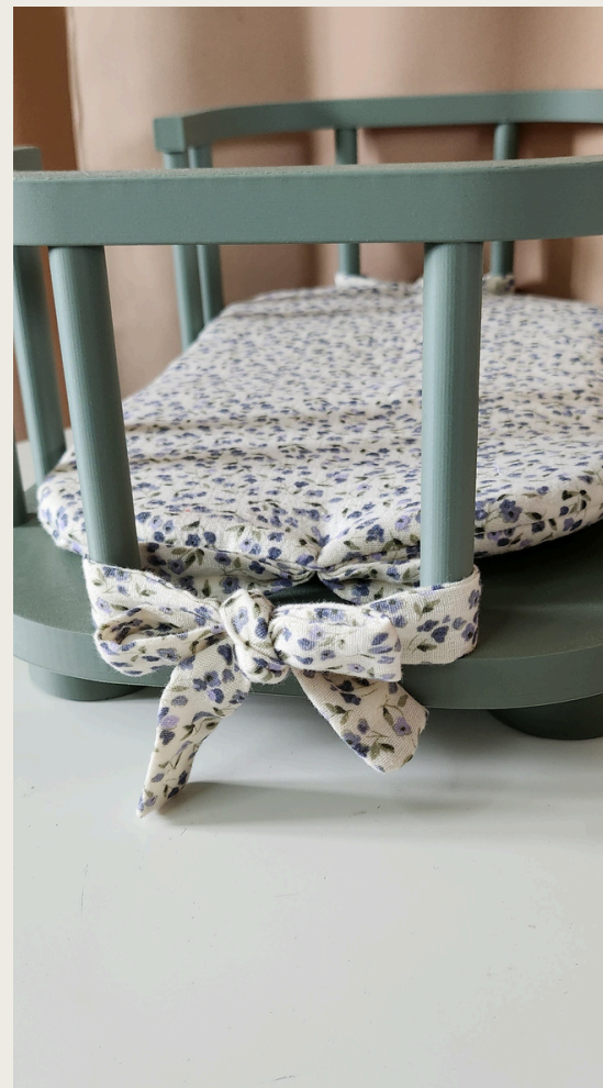
3. Następnie zwiąż i zawiń w kokardkę.