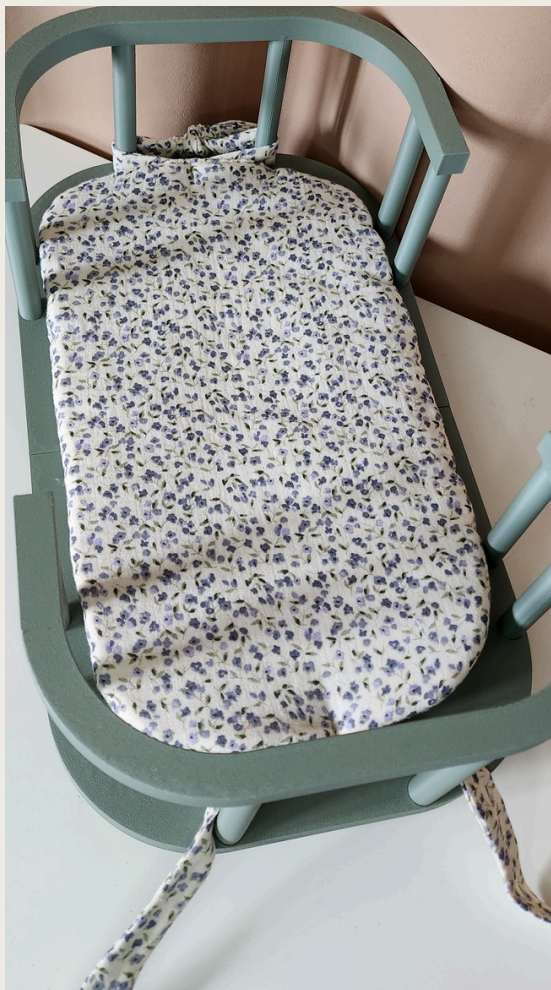
1. Połóż materacyk na łóżeczku