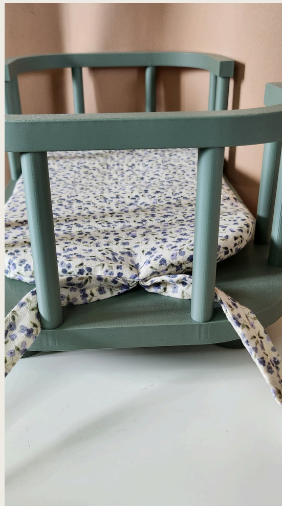
2. Paski rozłóż i owiń wokół prętów.